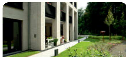
Albert-Schweitzer-Haus in Herne-Röhlinghausen