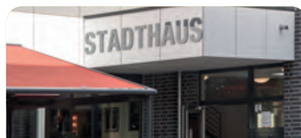
STADTHAUS in Herne-Mitte

Ein Einzug in unsere WGs ist unabhängig von Ihrer individuellen wirtschaftlichen Situation möglich. Gerne zeigen wir Ihnen, wie das Konzept unserer Senioren-WGs auch für Ihre persönliche Lebenssituation funktionieren kann. Vereinbaren Sie einfach einen unverbindlichen Beratungstermin.